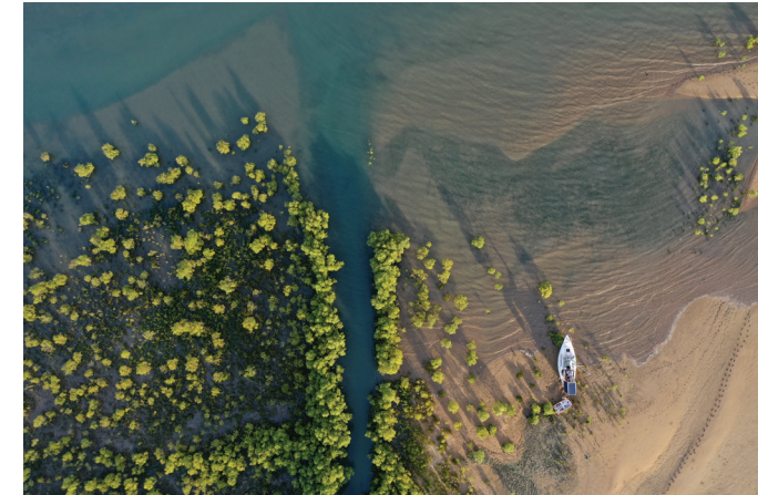
Mangrovenwald bei Niedrigwasser; Australien, Queensland, Townsville